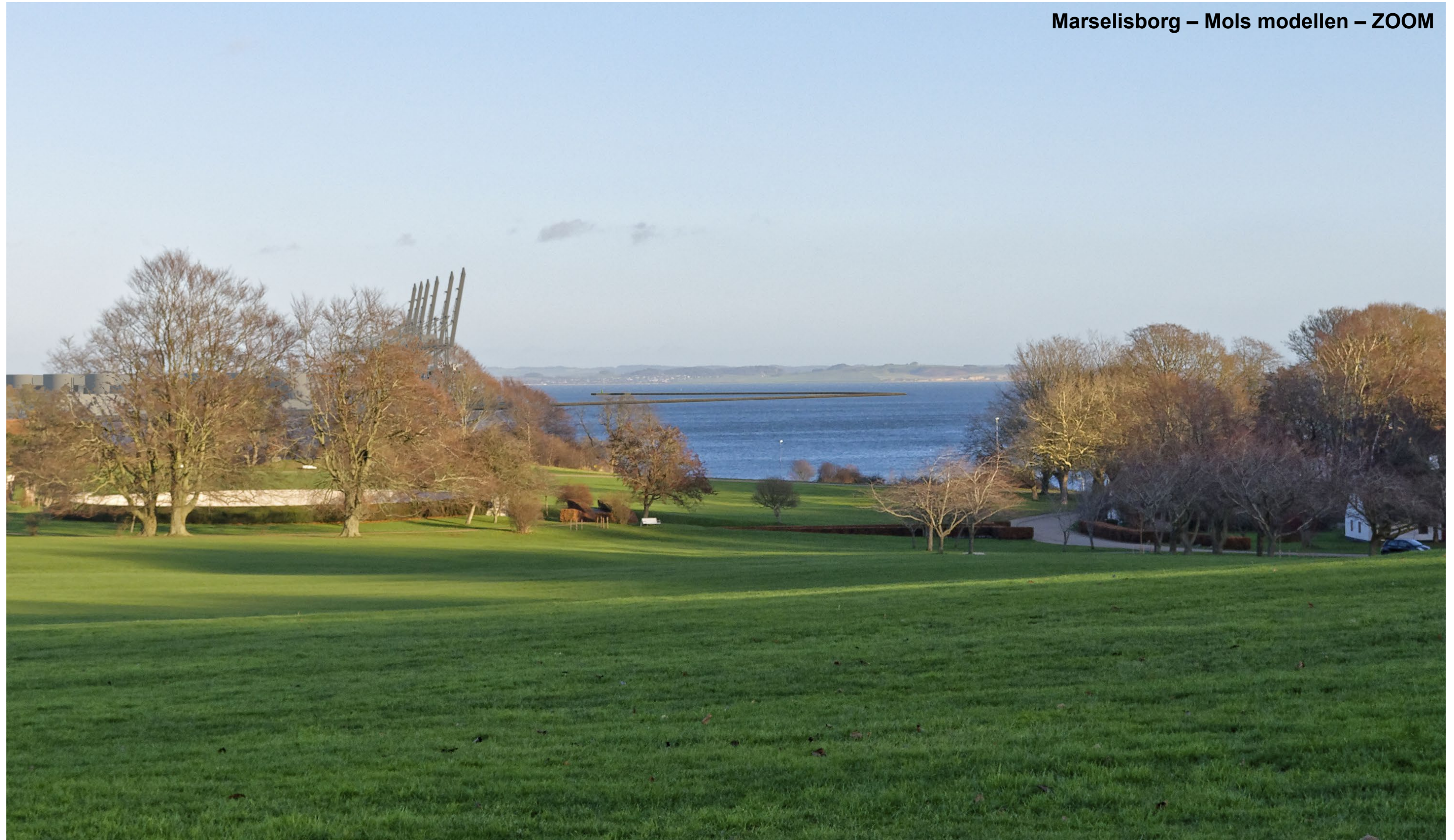
Marselisborg – Mols modellen – ZOOM